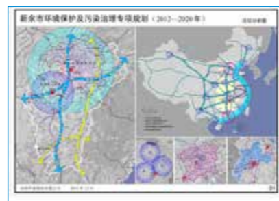
· 江西省新余市环境保护与污染治理专项规划

环境保护规划从环境保护角度出发，针对生态及环境保护、生态文明建设、区域流域污染治理、重点流域水污染防治、重金属污染综合防治、噪声污染防治等领域，为政府或企业制定在一定时期内、比较全面长远的环境保护计划，提供全方位的宏观指导。