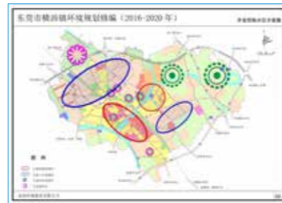
· 东莞市横沥镇国家生态文明建设示范镇规划