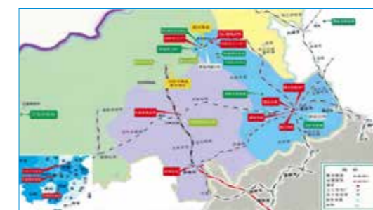
· 内蒙古伊泰集团有限公司中长期绿色发展规划